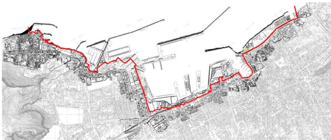
Porto di Palermo - Stato attuale

Tali interventi interesseranno l'intera area portuale e riguarderanno tutti i settori d'attività (traffico commerciale, traffico passeggeri, traffico crocieristico, cantieristica, diporto nautico, attività connesse all'uso urbano e alla fruizione del mare, etc.).