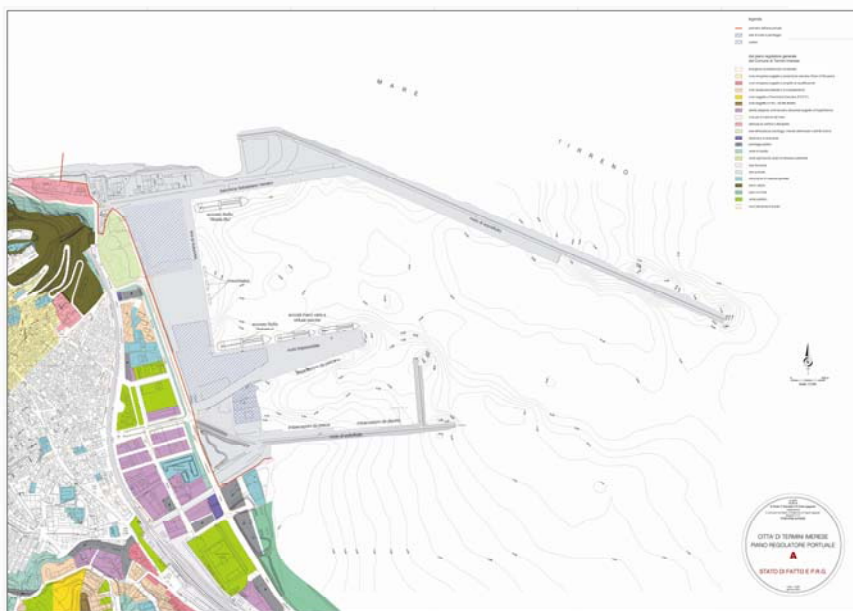
Termini Imerese-Stato Attuale

Sulla scorta delle indagini preliminari effettuate, è stato redatto un piano d'interventi relativo alle opere necessarie ed urgenti, per l'eliminazione delle principali criticità e per pervenire il prima possibile all'obiettivo primario perseguito dall'A.P. che prevede la piena operatività del Porto di Termini Imerese ed il rilancio dello stesso in sinergia con lo scalo palermitano. Nel corso del 2008 sono state effettuate indagini di tipo geognostico ed è stata avviata la progettazione definitiva dei seguenti interventi: