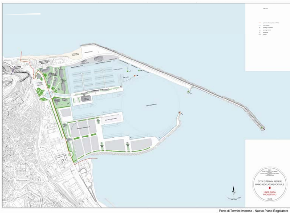
Termini Imerese-Nuovo Piano Regolatore

L'estensione della circoscrizione dell'Autorità Portuale di Palermo allo scalo di Termini Imerese, consentirà una nuova valutazione sinergica del sistema portuale della provincia e la possibilità di smistare adeguatamente i vari tipi di traffico; naturalmente risultano essenziali gli interventi per adeguamenti strutturali del porto.